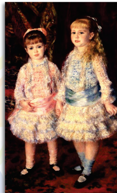
Les Demoiselles Cahen d'Anvers - Rose et Bleue Quadro original de Renoir