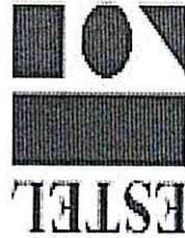
image001.jpg 4 KB

AVISO: ESTA MENSAGEM E SEUS ANEXOS CONTÉM INFORMAÇÕES CONFIDENCIAIS OU PRIVILEGIADAS. CASO VOCÊ TENHA RECEBIDO ESTA MENSAGEM POR ENGANO, QUEIRA, POR FAVOR, RETORNÁ-LA AO DESTINATÁRIO E APAGÁ-LA DE SEUS ARQUIVOS. QUALQUER USO NÃO AUTORIZADO, REPLICAÇÃO OU DISSEMINAÇÃO DESTA MENSAGEM OU PARTE DELA É EXPRESSAMENTE PROIBIDO.