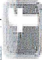
image006.jpg 907 B