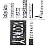
image001.png 29 KB

Antes de imprimir, pense na sua responsabilidade com o meio ambiente