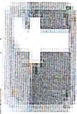
image002.jpg 909 B