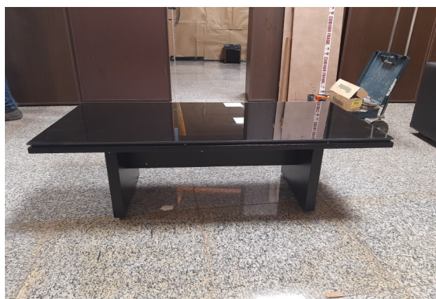
Mesa de Centro vista Lateral