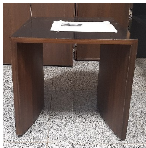
Mesa de Centro vista superior