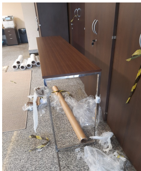
Aparador vista Lateral