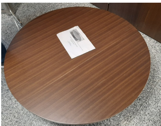
Mesa de Centro vista superior

Amostra única – Mesa de Centro – Bonte Ébano