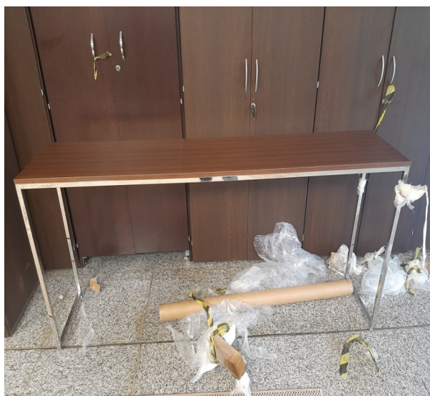
Aparador vista Frontal