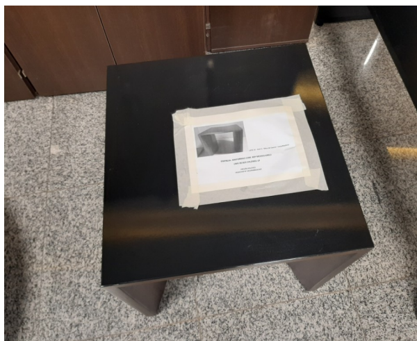
Mesa de Centro vista superior

Amostra única – Mesa de Centro – Laca/Madeira