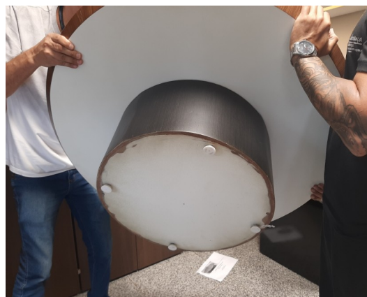
Mesa de Centro vista pés