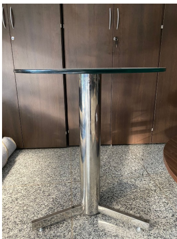
Mesa Lateral vista superior

Amostra única – Mesa Lateral Redonda / Diâmetro 600 mm