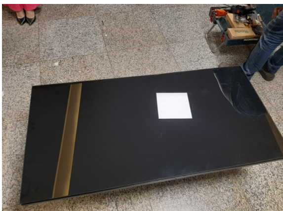
Mesa de Centro vista Superior

Amostra única – Mesa Redonda Centro Baixa